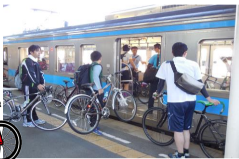
自転車をそのまま電車に持ち込みます