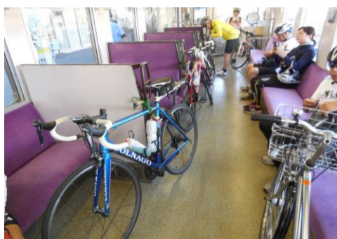
電車の旅を楽しみます♪