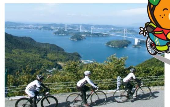
しまなみ海道サイクリングへ!