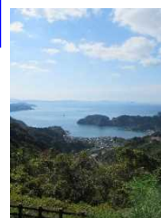
▲野福峠からの眺望

四国に存在する地域資源・文化資源を掘り起こし、地域と協働して付加価値付けされた観光素材・文化素材に磨き上げ、観光による地域活性化を目指す取り組みです。