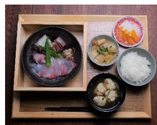
▲須崎のサカナ本舗での特別ランチ