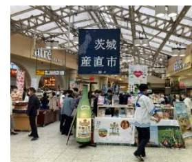
▲昨年の産直市の様子