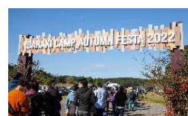
IBARAKI CAMP AUTUMN FESTA 2022の様子▲