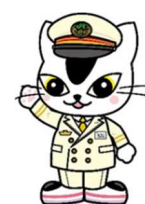
▲JR東日本水戸支社 E657系イメージキャラクタームコナくん