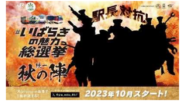
▲ティザービジュアル