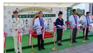
▲昨年のプレDCの様子(セレモニー)