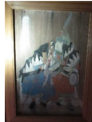
椿泊 佐田神社の絵馬

四国に存在する地域資源・文化資源を掘り起こし、地域と協働して付加価値付けされた観光素材・文化素材に磨き上げ、観光による地域活性化を目指す取り組みです。