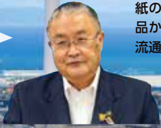
四国中央市 篠原 実市長

日本一の紙のまちを誇り、「パルプ・紙・紙加工品出荷額」、16年連続全国首位。具定展望台からの工場夜景は日本夜景遺産、日本夜景100選に認定。特産品は里芋、山の芋、水引細工、新宮茶など。産業の歴史や最先端技術など“紙のまち”四国中央市の魅力を、ぜひ体感してください。