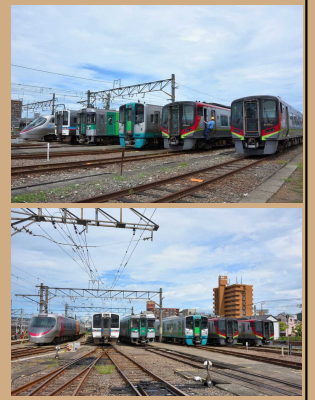
撮影写真イメージ(2022年7月30日14:00頃撮影) ※展示予定の車種は表面をご覧ください