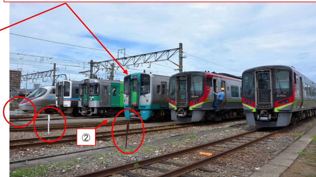
概ね右側面から撮影した場合

有効長の都合から、この線路に展示予定のキハ185系は1両での展示となります。（作例の角度から撮影いただくと、別の車両で後方が隠れます。）