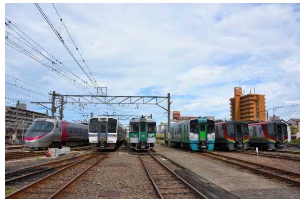
高松運転所（イメージ）