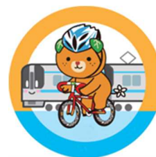
愛媛県イメージアップキャラクターみきゃん 許諾番号 401028