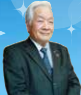
新居浜市 石川市長

新居浜市は世界有数の産出量を誇った別子銅山の開坑以来、銅(あかがね)のまちとして発展してきました。今回は、自然と共存し、工業都市として発展してきた新居浜市の魅力を歴史とともに紐解いていく内容となっています。観光として楽しみながらも、先人の想いや史実を通して、未来に繋がるSDGsのヒントも得られる学びの多い旅となると期待しております。