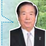
観音寺市長 白川 晴司

香川県最西端に位置する観音寺市は、天空の鳥居をはじめとする数々の名所に出会えるまちです。先人が築き上げてきた歴史や文化に触れて、本市の魅力を感じてください。