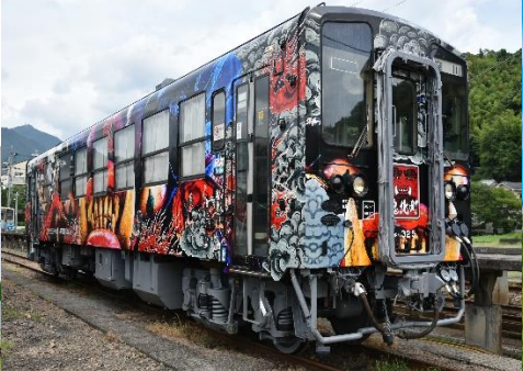
(写真は全てイメージです)