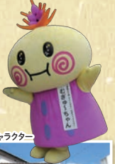
むぎゅ〜ちゃん 讃岐もち麦ダイシモチ公式キャラクター 普通寺市観光大使

「ダイシモチまんが 学ぶ講座」を開催。ダイシモチの家系や栄養満点レシピについて学びます。