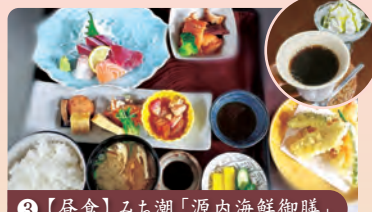
③【昼食】みち潮「源内海鮮御膳」

源内の多彩な業績を展示する記念館を見学し、その足跡をたどります。エレキテルも実際にご覧いただけます。