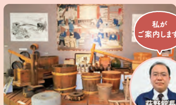
④ 東かがわ市歴史民俗資料館

津田湾が目の前に広がる眺めのいい海鮮料理店にて、新鮮な海産物を使用したお食事をお楽しみいただけます。和三盆を使ったデザートつき!