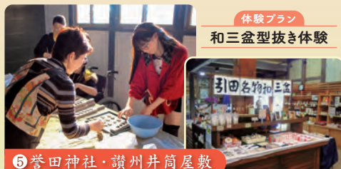
⑤ 誉田神社・讃州井筒屋敷

東かがわ市の地場産業のほか、地域の歴史・民俗に関する資料が展示された資料館。砂糖づくりに必要な道具などを見ることができます。