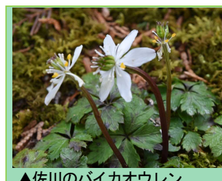
▲佐川のバイカオウレン