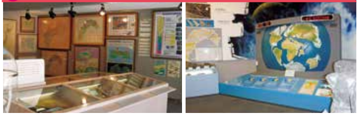
研究史コーナー(各地質図の変遷)