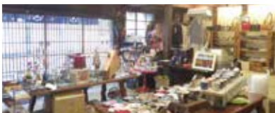
【旧竹村呉服店(キリン館)】