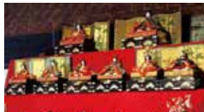
町内(上町地区)約10か所でひな飾りを展示。