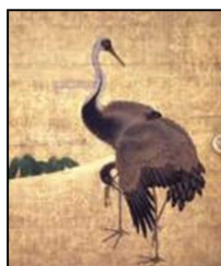
知恩院 大方丈（重文） 鶴の間 障壁画