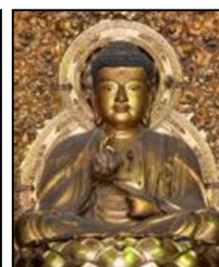
妙心寺 仏殿（重文） 釈迦如来像