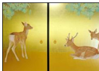
宝鏡寺 本堂 襖絵「葡萄と鹿」

JRグループでは、桜や紅葉などの自然の魅力だけではなく、文化財や伝統文化・産業などの奥深い京都の魅力を伝え、冬の時期にゆっくりと観光を楽しんでいただけるように、2020年1月1日（水・祝）から3月22日（日）までの間、京都市・公益社団法人京都市観光協会などと共同で、京都デスティネーションキャンペーン「京の冬の旅」を実施します。