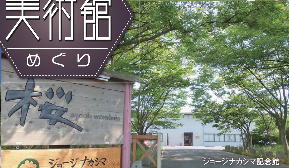
ジョージナカシマ記念館