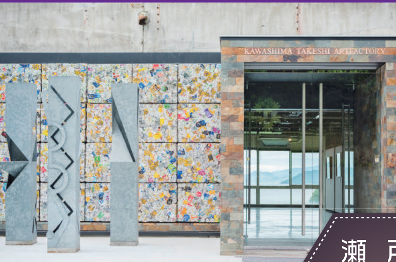
川島猛アートファクトリー