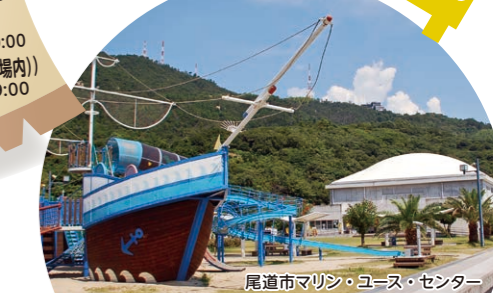
尾道市マリン・ユース・センター