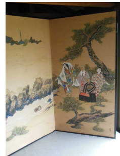
▲長尾寺静御前の襖絵