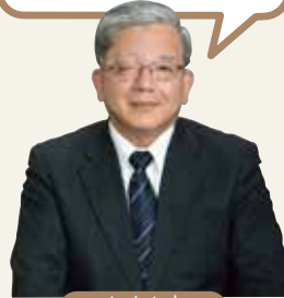
さぬき市 大木 茂樹 市長