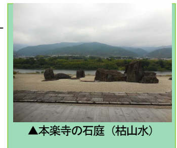
▲本楽寺の石庭（枯山水）

2 募集内容 ・募集人員／各日22名（最少催行人員／各日16名） ・添乗員／同行しませんが、穴吹駅から当社係員がご案内いたします。 ・食事条件／昼食1回 ・歩行距離／約0.8km ・参加条件／歩きやすい服装、履き慣れた靴でご参加ください。