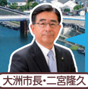
大洲市長・二宮隆久

屋形船からは、川面に新緑や紅葉が鏡のように映りこみ、臥龍山荘の不老庵や大洲城の様子が一望でき、その風情ある光景は壮観です。多くの皆様の参加をお待ちしております。