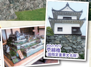
おきたまの 宗徳櫓 (国指定重要文化財)

鎌倉時代末期に築かれた地蔵ヶ嶽城に始まったと言われる大洲城。小早川隆景をはじめ、戸田勝隆、藤堂高虎、脇坂安治、加藤貞泰ら大洲の地を治めた大名達の造営を経て、城郭が整備されました。天守は、慶長年間(1596~1614)に築かれたと言われ、藤堂高虎の築城説と脇坂安治の移築説があります。その天守が明治期に姿を消して百余年…平成16(2004)年、四層四階の木造天守が威風堂々とした往年の姿で甦りました。誰が大洲城天守を築城したのか?なぜ伝統と気品を感じさせる正しい姿に復元できたのか?大洲城の謎を解き明かします。