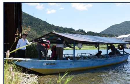
▲大洲の屋形船イメージ