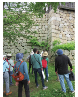
丸亀のまちでジオとまちづくりを探索する「四国家のお宝」

2022年度には、丸亀市から公認プロジェクトとして承認され、会員企業有志で、子供向けのお仕事体験イベントなど、さまざまな取り組みを行っています。