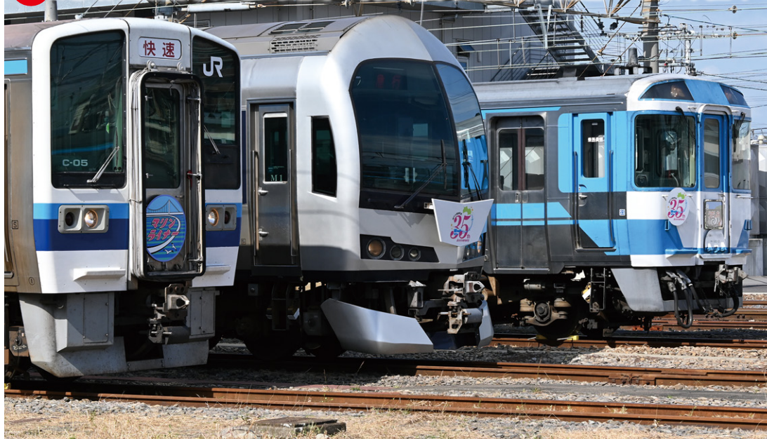
左から213系初代マリンライナー、5000系現行マリンライナー、キハ185系(213系「リバイバルマリンライナー」の旅)